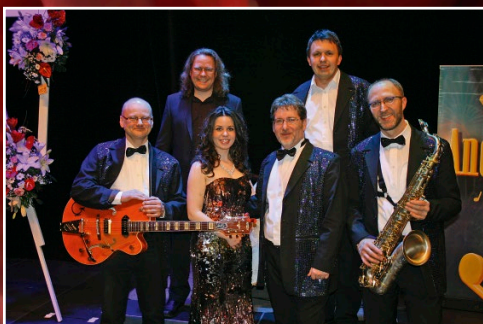
ANDORRAS Tanz- und Galaband